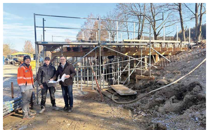
Neubau des Stegs am Badesee in Altenveldorf