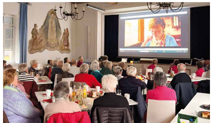
Organisation des Treffens für verwitwete Personen durch den Frauenbund Velburg