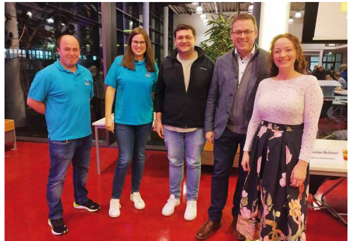
Herbstversammlung des Kreisjugendrings Neumarkt