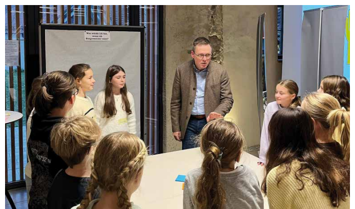
Jugendbürgerversammlung im Wieserstadt