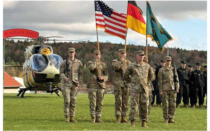
Joint Multinational Readiness Center – Relinquishment of Responsibility Ceremony der Army Hohenfels