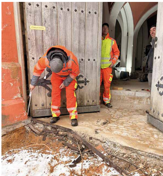
Öffnung des alten Rathaus-Tores