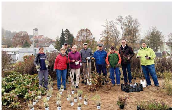
Pflanzaktion und Neugestaltung des Kreisverkehrs am Pilgram