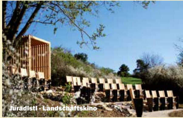
Juradistl - Landschaftskino

Ein Kino, das keine Leinwand braucht, weil der Film die Landschaft ist. Das ist die Idee des „Juradistl-Kinos“! Es ist im Rahmen des landkreisübergreifenden Biodiversitätsprojekts „Juradistl“ entstanden. Wenn Sie dem Kuppenalb - Wanderweg folgen, entdecken Sie das Kino nur 400m nordöstlich von Hilzhofen.