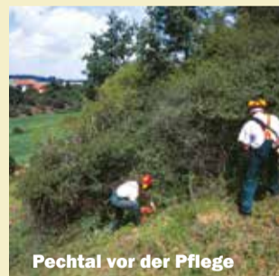
Pechtal vor der Pflege

Heute werden diese Flächen oft nicht mehr beweidet und drohen durch Verbuschung ganz zu verschwinden.